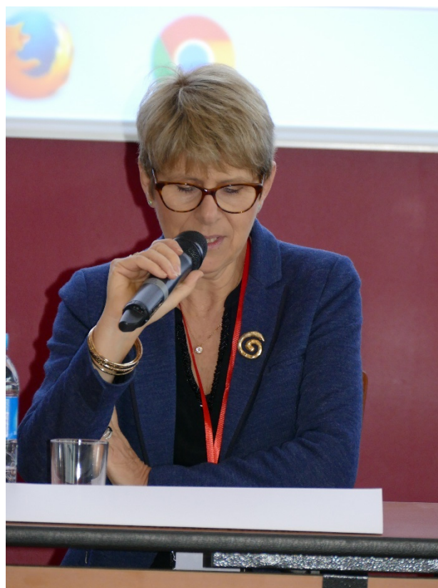
Mme Monique OLLIVIER, Procureur général près la cour d'appel de TOULOUSE