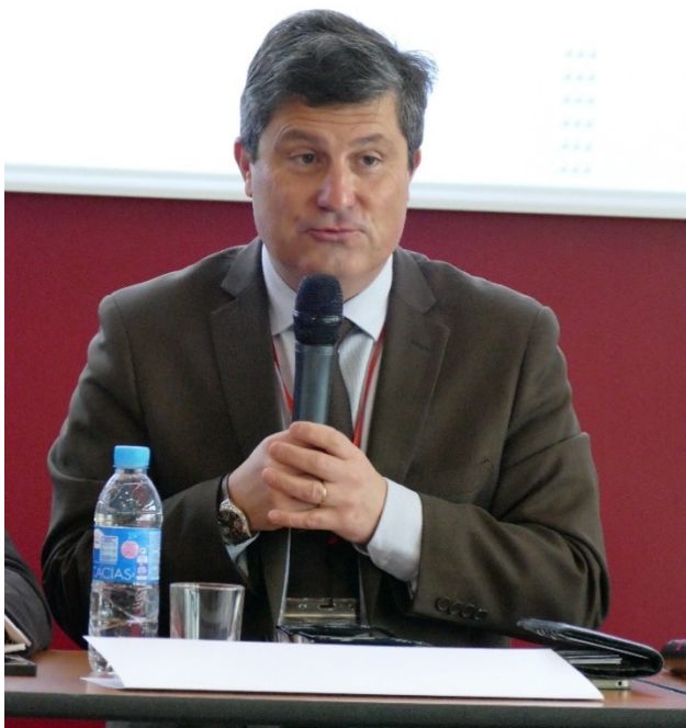
M. Jacques BOULARD, Premier président de la cour d'appel de TOULOUSE

Tous les deux ans, depuis plusieurs décennies, la Compagnie organise un colloque rassemblant les magistrats, les avocats et les experts pour traiter d'un sujet aux diverses approches. Chantier majeur de l'année 2017, ce colloque avait pour thème « Peut-on croire en la justice en 2017 ? – De la loi à l'éthique ». Plus de 260 personnes y ont participé et ont loué les modes de présentation interactifs qui ont permis une libre expression. Les retours très positifs ne peuvent que nous inciter à poursuivre ces actions.