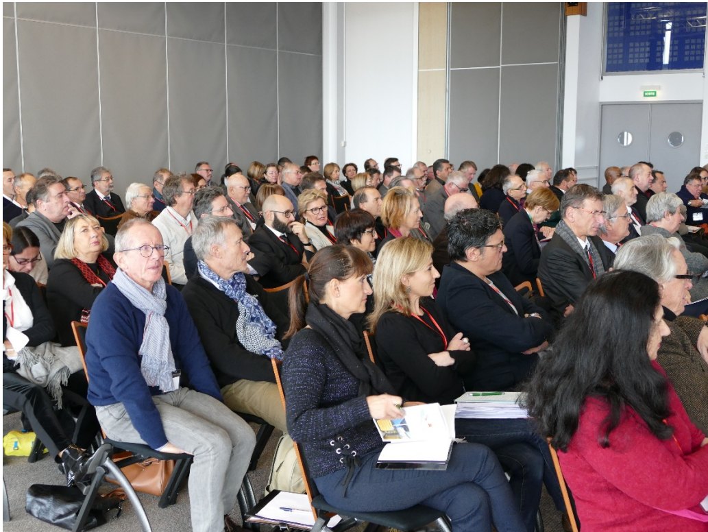
L'assistance, composée de magistrats, d'avocats et d'experts