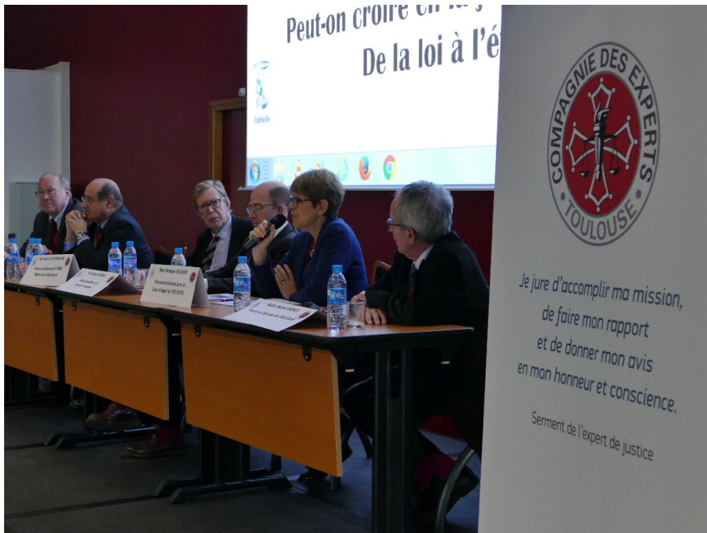
N'oublions pas le serment de l'expert de justice